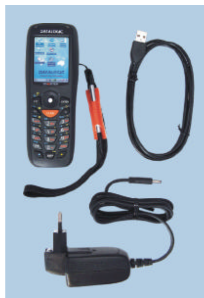
Contenuto del kit (standard)

Nota: Tutte le specifiche sono soggette a modifiche. Per le specifiche tecniche del prodotto far sempre riferimento al manuale in dotazione per l'utente