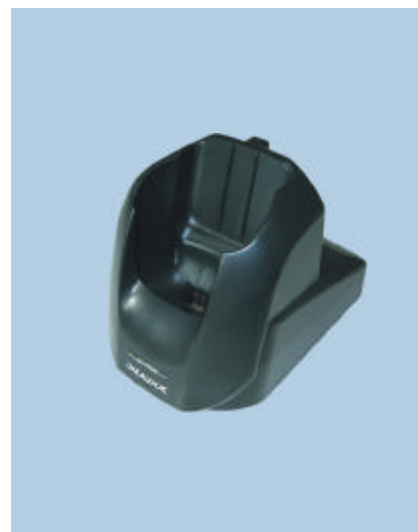
Culla singola (opzionale)