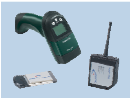
Dragon/DL Cordless Card/STAR★Modem™